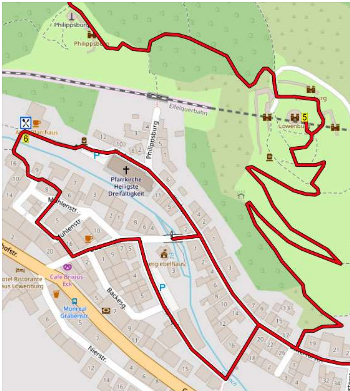
(Samenstelling route: Jan Nobbe en Jos Wlazlo).

Auteur: Jos Wlazlo Het Auteursrecht van deze tekst en het Databankenrecht op deze route ligt volledig bij de auteur. Niets van deze wandelroute mag worden gekopieerd, veelevoudigd of openbaar gemaakt zonder toestemming van de auteur.