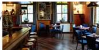
Cafe-zaal "De SCHUIF" Gemonde

Startadres: Café – Zaal De Schuif, Dorpstraat 30, Gemonde. Tel; 073-551288. Geopend: Dagelijks vanaf 10.30 uur, dinsdag gesloten. Parkeer links van het café op de grote parkeerplaats.