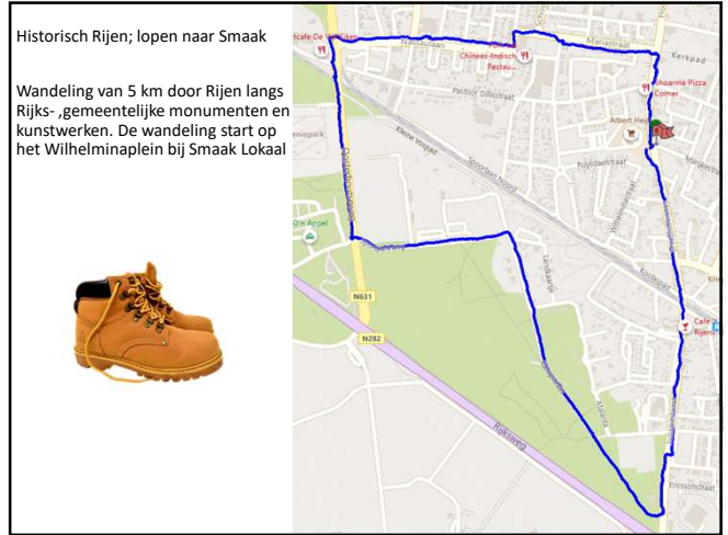
Historisch Rijen; lopen naar Smaak

Wandeling van 5 km door Rijen langs Rijks- ,gemeentelijke monumenten en kunstwerken. De wandeling start op het Wilhelminaplein bij Smaak Lokaal