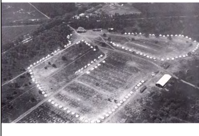
Oosterhoutseweg 13 voormalig Kinderkamp vanuit de lucht