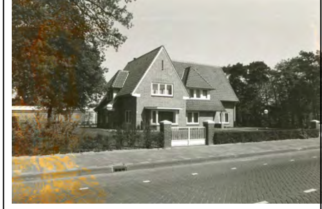
Julianastraat voormalige directiewoning van de Ericsson; Vanuit de Kampstraat komt u in de Julianastraat waar u de weg naar links vervolgt