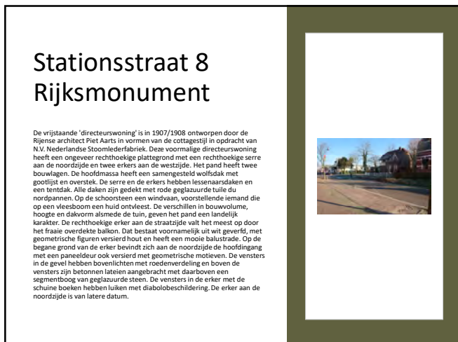
Stationsstraat 8 Rijksmonument

De vrijstaande 'directeurswoning' is in 1907/1908 ontworpen door de Rijense architect Piet Aarts in vormen van de cottagesstijl in opdracht van N.V. Nederlandse Stoomliefderfabriek. Deze voormalige directeurswoning heeft een ongeveer rechthoekige plattegrond met een rechthoekige serre aan de noordzijde en twee erkers aan de westzijde. Het pand heeft twee bouwlagen. De hoofdmasse heeft een samengesteld wolfsdak met gootlijst en overstek. De serre en de erkers hebben lessenaarsdaken en een tentdak. Alle daken zijn gedekt met met rode geglaazuurde tuile du nordpannen. Op de schoorsteen een windvaan, voorstellende iemand die op een vleesboom een huid ontveest. De verschillen in bouwvolume, hoogte en dalkvorm alsmede de tuin, geven het pand een landelijk karakter. De rechthoekige erker aan de straatzijde valt het meest op door het fraaie overdekte balkon. Dat bestaat voornamelijk uit wit geveerd, met geometrische figuren versierd hout en heeft een mooie balustrade. Op de begane grond van de erker bevindt zich aan de noordzijde de hoofdingang met een paneeldeur ook versierd met geometrische motieven. De vensters in de gevel hebben bovenlichten met roedenverdeling en boven de vensters zijn betonnen latieren aangebracht met daarboven een segmentboog van geglaazuurde steen. De vensters in de erker met de schuine boeken hebben luiken met diabolobeschildering. De erker aan de noordzijde is van latere datum.