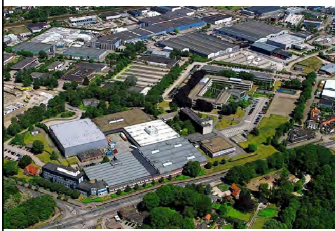
Julianastraat luchtfoto van de Ericsson;