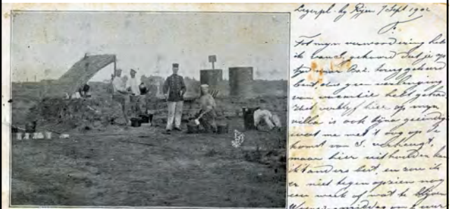
De Keuken van het Legerkamp te Rijen.