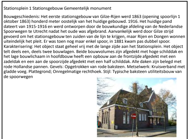
Stationsplein 1 Stationsgebouw Gemeentelijk monument

Bouwgeschiedenis: Het eerste stationsgebouw van Gilze-Rijen werd 1863 (opening spoorlijn 1 oktober 1863) honderd meter oostelijk van het huidige gebouw. 1916. Het huidige pand dateert van 1915-1916 en werd ontworpen door de bouwkundige afdeling van de Nederlandse Spoorwegen te Utrecht nadat het oude was afgebrand. Aanvankelijk werd door Gilze strijd gevoerd om het stationsgebouw ten zuiden van de lijn te krijgen, maar Rijen en Dongen wonnen uiteindelijk het pleit. Er was toen nog maar enkel spoor, in 1881 kwam pas dubbel spoor. Karakterisering: Het object staat geheel vrij met de lange zijde aan het Stationsplein. Het object telt deels een, deels twee bouwlagen. Beide bouwvolumes zijn afgedekt met hoge schilddak en het lage bouwlichaam in hoofdbouw heeft een opbouw aan de frontzijde afgedekt met een zadeldak en een aan de spoorzijde afgedekt met een half schilddak. Alle daken zijn belegd met rode Hollandse pannen. Gevels: Opgetrokken van rode baksteen. Metselwerk: Kruisverband met gladde voeg. Plattegrond; Onregelmatige rechthoek. Stijl: Typische baksteen utiliteitsbouw van de spoorwegen