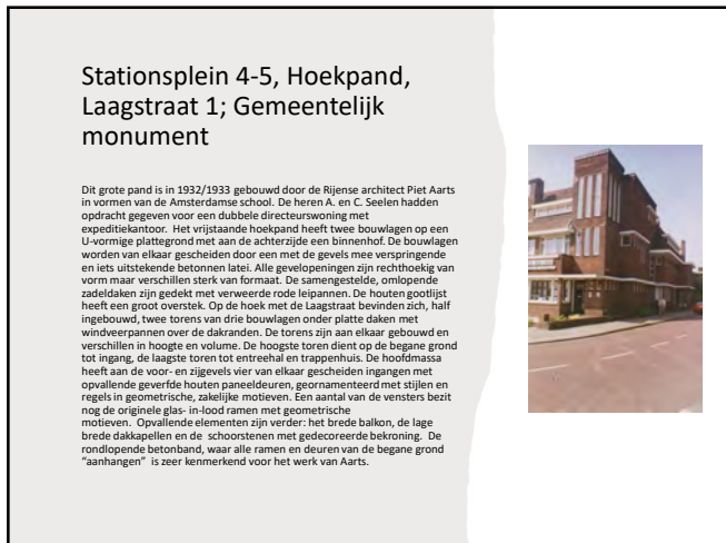
Stationsplein 4-5, Hoekpand, Laagstraat 1; Gemeentelijk monument