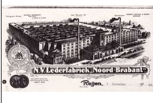
Julianastraat 1920ca voormalige leerlooierij N.V. Lederfabriek "Noord Brabant"