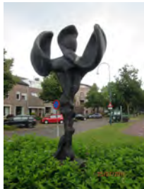
'De derde wethouder'