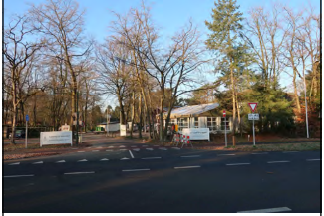
Oosterhoutseweg 13, Camping d'n Mastendol steek hier de Oosterhoutseweg over naar de Sportparkweg