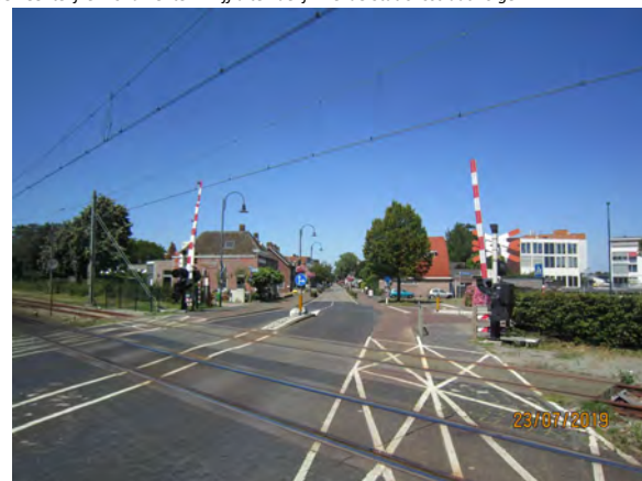
Julianastraat – Stationsstraat; steek de spoorlijn over en links op het Stationsplein enkele Gemeentelijke monumenten. Blijf uiteindelijk wel de Stationsstraat volgen