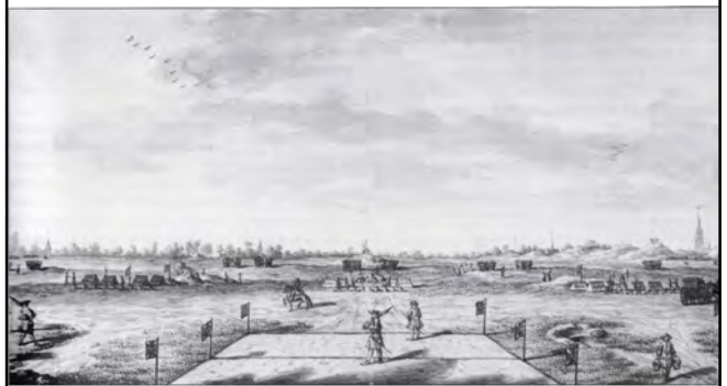
Overzicht gelegerde troepen (Camp de Bataille). Uit: Moetjens, 1732