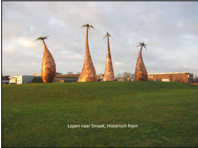
Lopen naar Smaak; Historisch Rijen