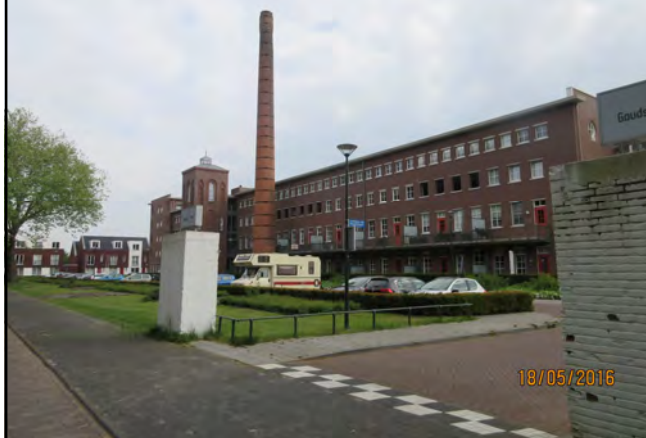
Julianastraat 38 appartementencomplex met de oude schoorsteen van de voormalige leerlooierij Noord Brabant. Blijf de Julianastraat volgen