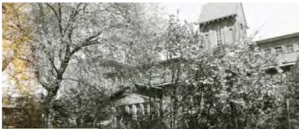
Julianastraat 38; 2 Platanen, Platanus acerifolia;

Plataan Platanus hybrid De Plataan wordt bij ons veel in omheiningen geplant, omdat het een van de weinige bomen is die geen last heeft van de verruilde lucht. Zijn glanzende bladeren worden door de regen weer schoongepoet en de schone kast geeft het in grote plantkassen toe, wat bewaakt dat de schoneplant in de kast een vanderwijze krijgt. De Plataan is een hybride tussen de Westerse of Amerikaanse Plataan ( P. occidentalis ) en de Chinese Plataan ( P. orientalis ). De eerst vermeld in 1875 voor het eerst beschreven aan de hand van een tekening in de Nieuwe Hollandische Courant. Vermoedelijk van de afkomst van John Tradescant de Jongere (1608-1662), luitenant van Karel I. Tradescantus vader had een kweekvijl opgericht en later kweekte de Chinese en de Westerse Plataan voort. De onaangetastheid van een kweekvijl waart die aanwijzing. In 1875 werden ook twee andere soorten beschreven, namelijk de witte en de zwarte Plataan. De Plataan vraagt een vruchtbare, vochtige grond. Hij groeit snel en vormt op zijn plaats een boomstam, die een stevige voet sticht in de herfst. Het hout is bij op bereikbaar, het is licht, maar een beetje zwaar.