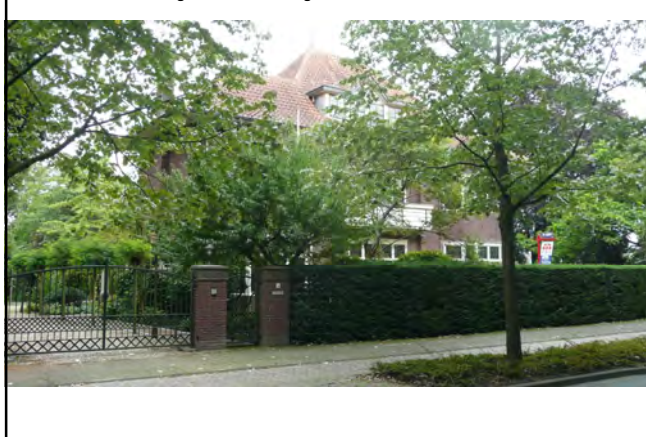
Julianastraat 34 voormalige directeurswoning