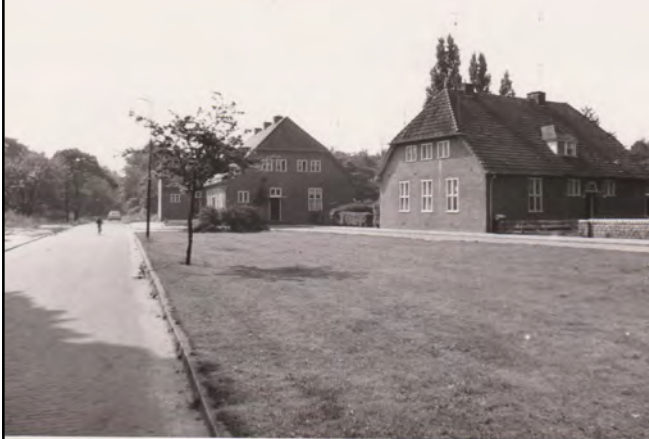
De Atalanta gaat over in de Kampstraat; foto Kampstraat 1 t/m 9 1978; blijf de weg vervolgen