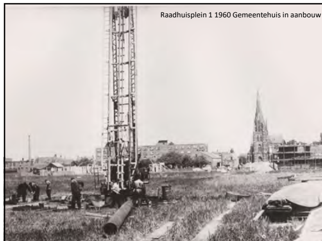
Raadhuisplein 1 1960 Gemeentehuis in aanbouw