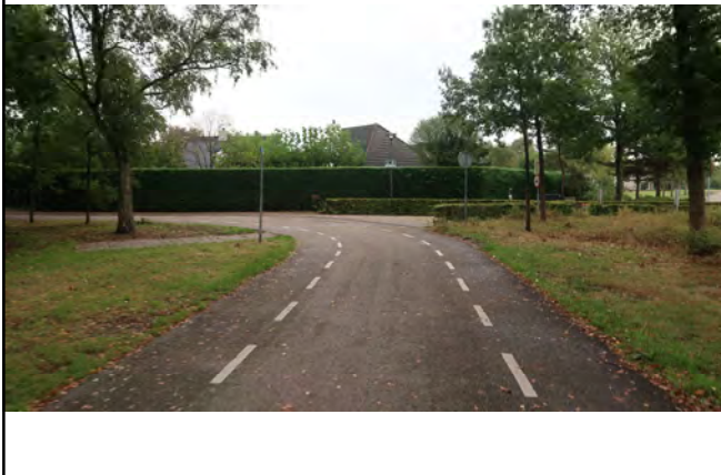
Sportparkweg; in de bocht wandelt u rechtsaf de Atalanta in, de voormalige Siedlung