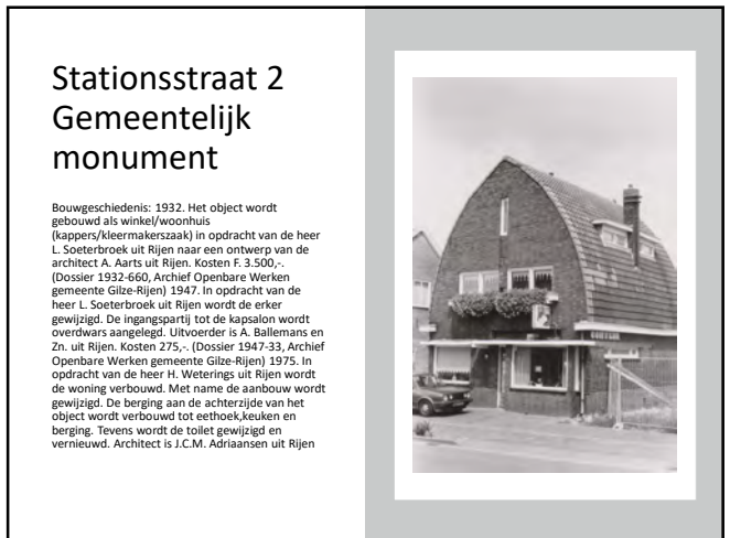
Stationsstraat 2 Gemeentelijk monument