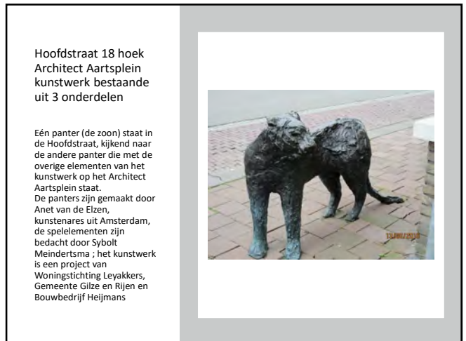
Hoofdstraat 18 hoek Architect Aartsplein kunstwerk bestaande uit 3 onderdelen