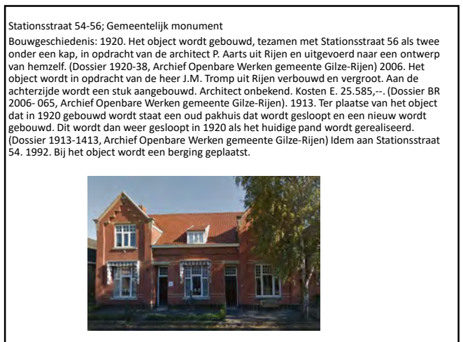
Stationsstraat 54-56; Gemeentelijk monument