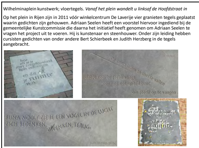
Wilhelminaplein kunstwerk; vloertegels. Vanaf het plein wandelt u linksaf de Hoofdstraat in