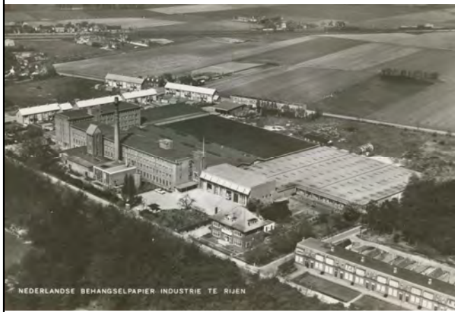
Julianastraat 38; voormalig Behangselpapier fabriek; ansichtkaart