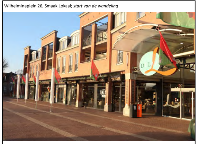
Wilhelminaplein 26, Smaak Lokaal; start van de wandeling