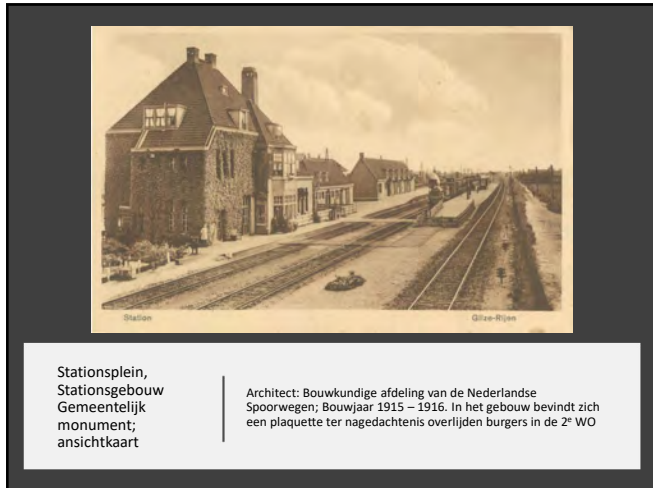
Stationsplein, Stationsgebouw Gemeentelijk monument; ansichtkaart

Architect: Bouwkundige afdeling van de Nederlandse Spoorwegen; Bouwjaar 1915 – 1916. In het gebouw bevindt zich een plaquette ter nagedachtenis overrijden burgers in de 2 e WO