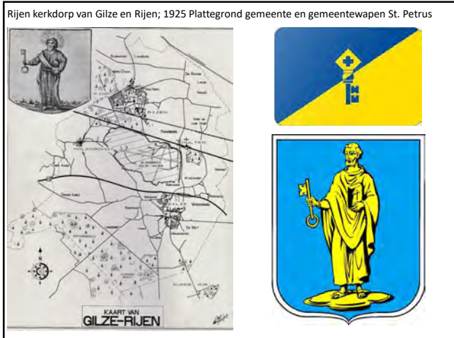
Rijen kerkdorp van Gilze en Rijen; 1925 Plattegrond gemeente en gemeentewapen St. Petrus