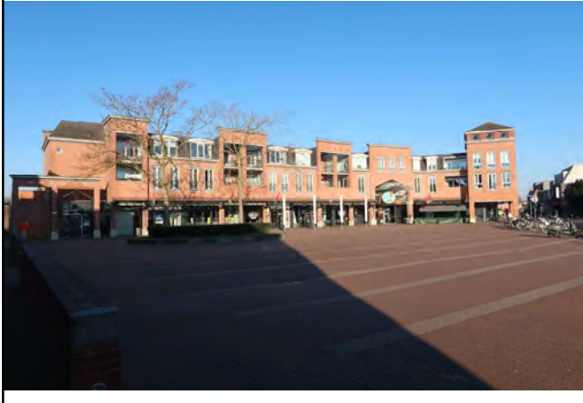
Wilhelminaplein winkelcentrum de Laverije; einde wandeling