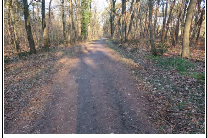
Kampstraat, blijf het bospad alsmaar volgen tot aan de Julianastraat