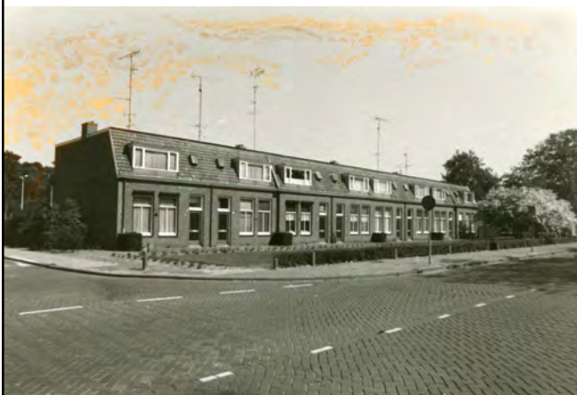
Julianastraat; voormalige woningen van Ericsson